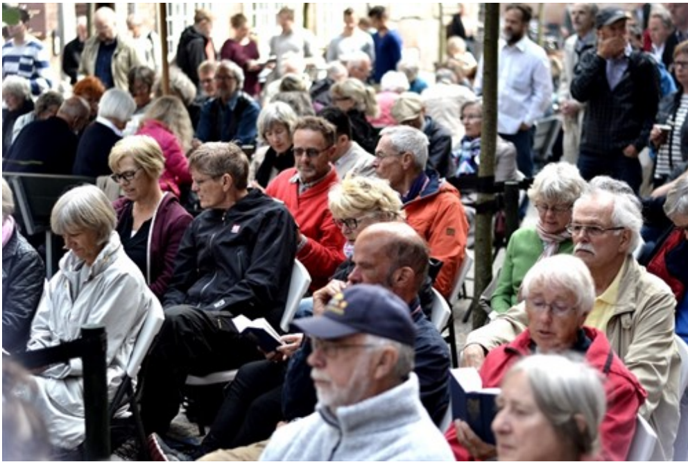
Jakkerne kom af da solen brød frem.