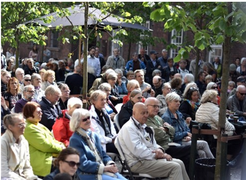
Fuldt hus i Vartovs gård denne formiddag.

Folketinget har vedtaget tiltrædelsesloven i forbindelse med Danmarks indtræden i EU i 1972, og hvis Folketinget eksplicit ønsker det, kan det justere denne lov.