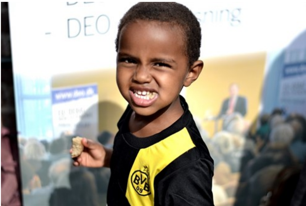
Mødets yngste deltager.