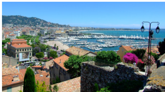
Lystbådehavnen i Cannes.