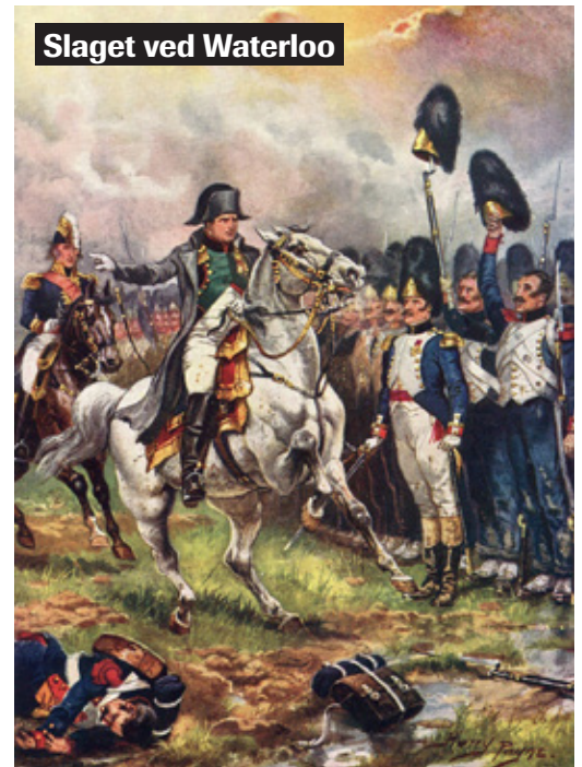
Slaget ved Waterloo