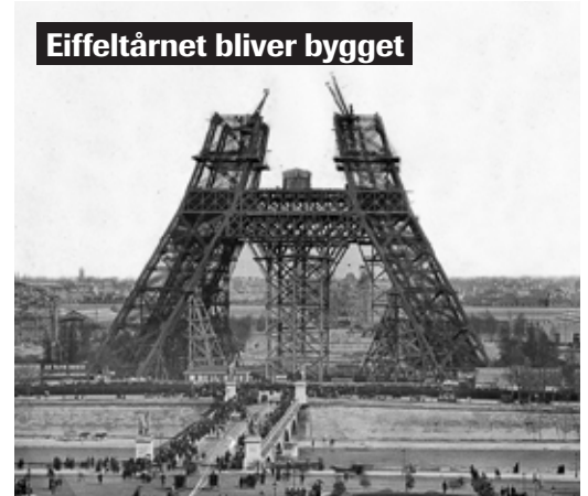
Eiffeltårnet bliver bygget