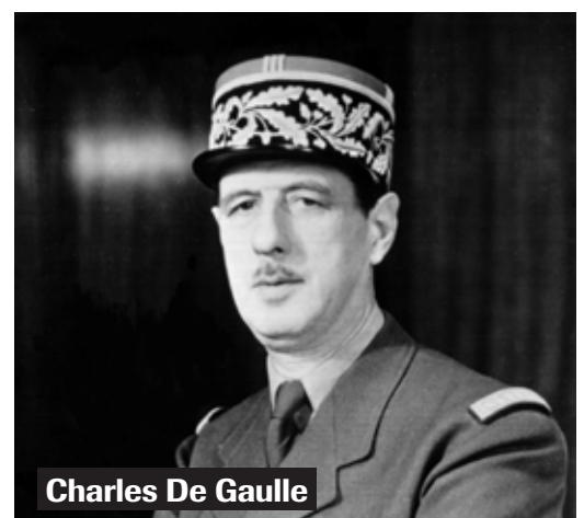
Charles De Gaulle