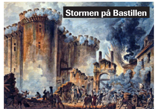
Stormen på Bastillen