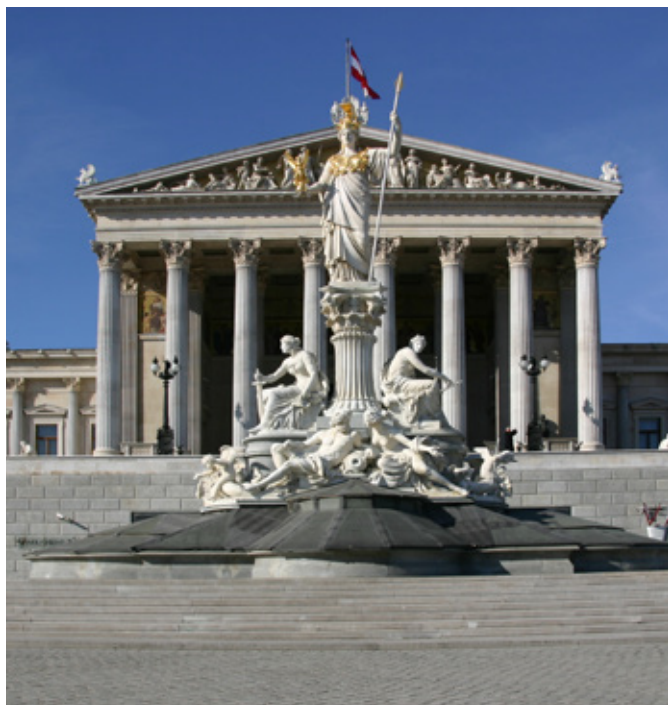
Østrigs parlamentsbygning i Wien.