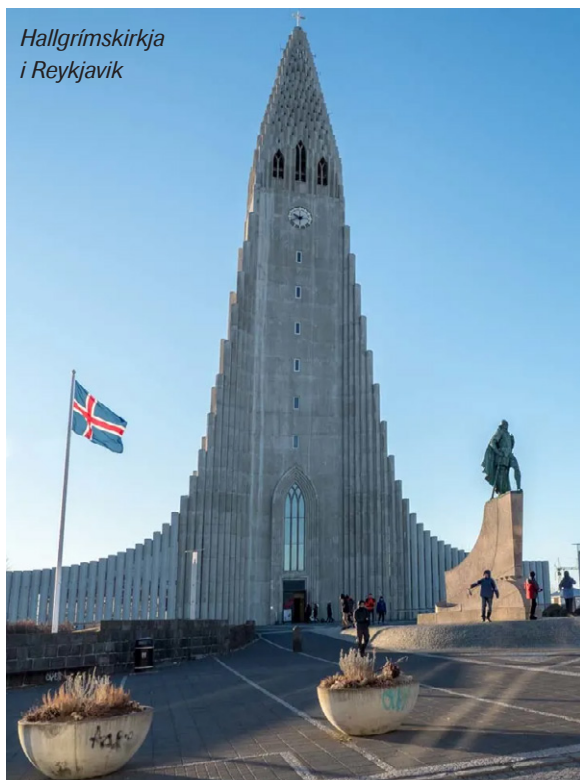
Hallgrímskirkja i Reykjavik