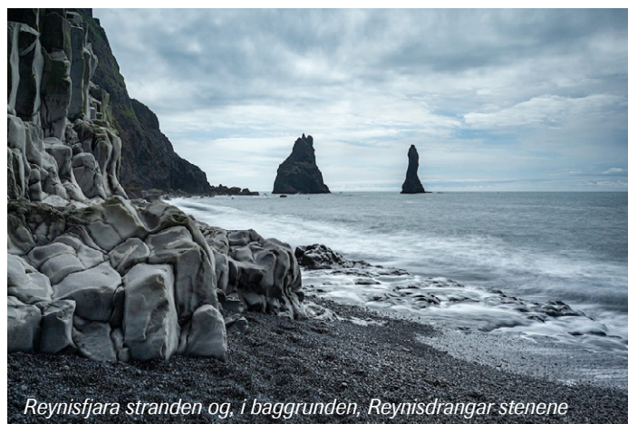
Reynisfjara stranden og, i baggrunden, Reynisdrangar stenene

Nisserne har endda deres egne politiske interesserrepræsentanter, der i relation primært til miljøbeskyttelse, forsøger at stoppe konstruktion på islandske naturområder, der kan bringe deres naturlige bosteder i fare.