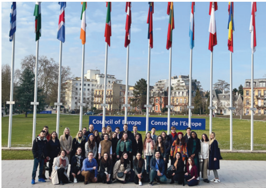
Ungdomsdelegater ved Europarådet i Strasbourg, marts 2022.

Gennem civilsamfundet kan unge også blive engageret i europæiske tematikker. Organisationen European Debate Initiative (EDI) forankrer den europapolitiske debat i Danmark, og er fokuseret på f.eks. klima, flygtninge og