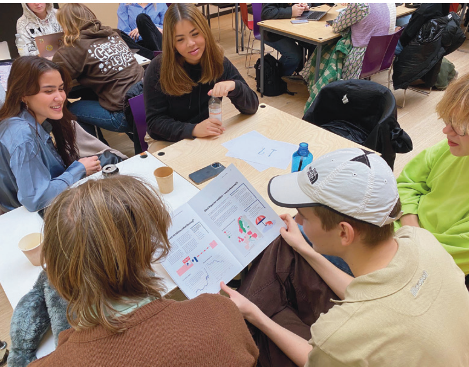
Elever fra Gefion Gymnasium forbereder sig til forhandlingerne.

Øjeblikket efter bliver tallet plottet ind i et interaktivt skema, så alle elever kan se konsekvenserne for hele EU. Udmeldingen fra Spanien rækker ikke meget på hele unionens budget, så nu er der lagt pres på finansministeren fra Tyskland, der skal tale om lidt. Den seneste gymnasiereform fremhæver, at gymnasieele-