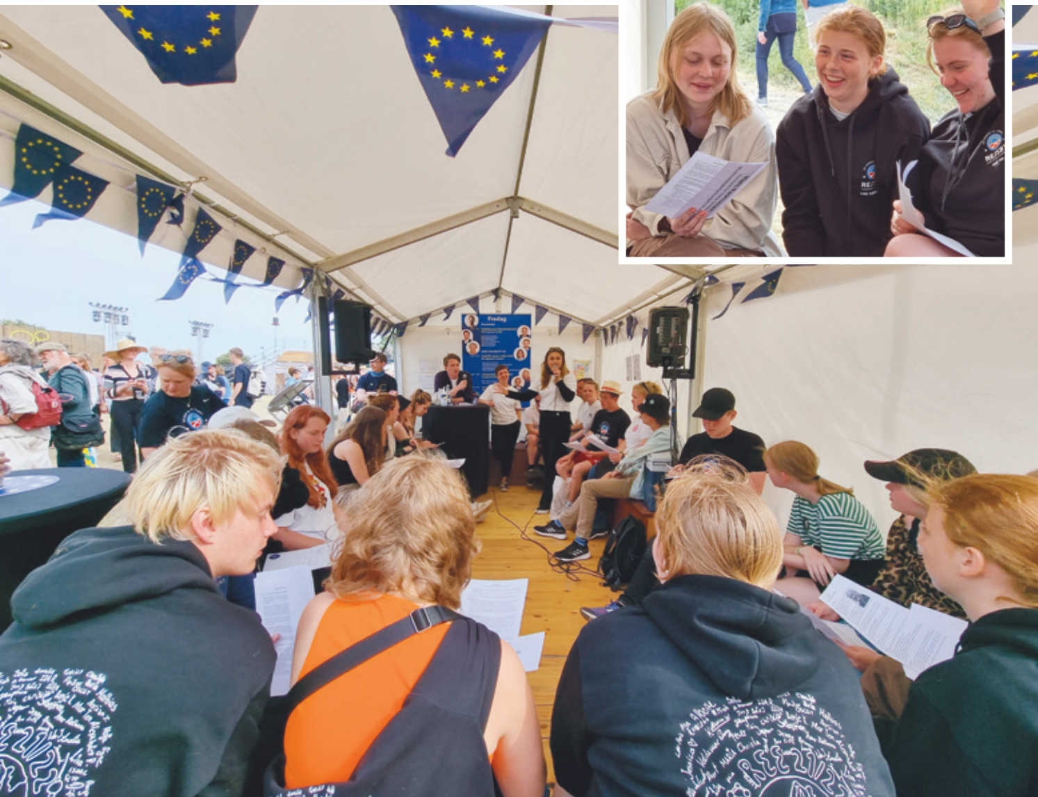
Rollespil på Folkemødet 2022 med elever fra Rejsby Europæiske Efterskole.