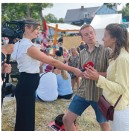
EU Ungdomsdelegater interviewes i News & Co på TV2 News, Folkemødet 2022.

Ønsker man indflydelse på europæiske og globale dagsordner, kan man blive Ungdomsdelegat for EU, FN eller Norden gennem Dansk Ungdoms Fællesråd. Som EU Ungdomsdelegat repræsenterer jeg danske unges interesser i EU, mødes med ministre, og arbejder med formidling og forankring af europæiske dagsordner i Danmark. Næste mandatperiode starter i 2024, og man søger gennem DUF .