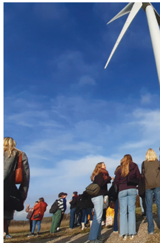
Elever på ekskursion til DTU Risø.