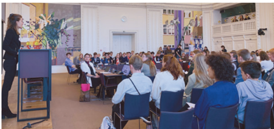
Ungdommens EU-Topmøde 2022 i Folketinget, marts 2022.

Alt i alt findes der rigtig mange gode muligheder for at blive engageret – og interesseret – i europæiske spørgsmål. I skal være velkommen til at kontakte mig for yderligere information. ■