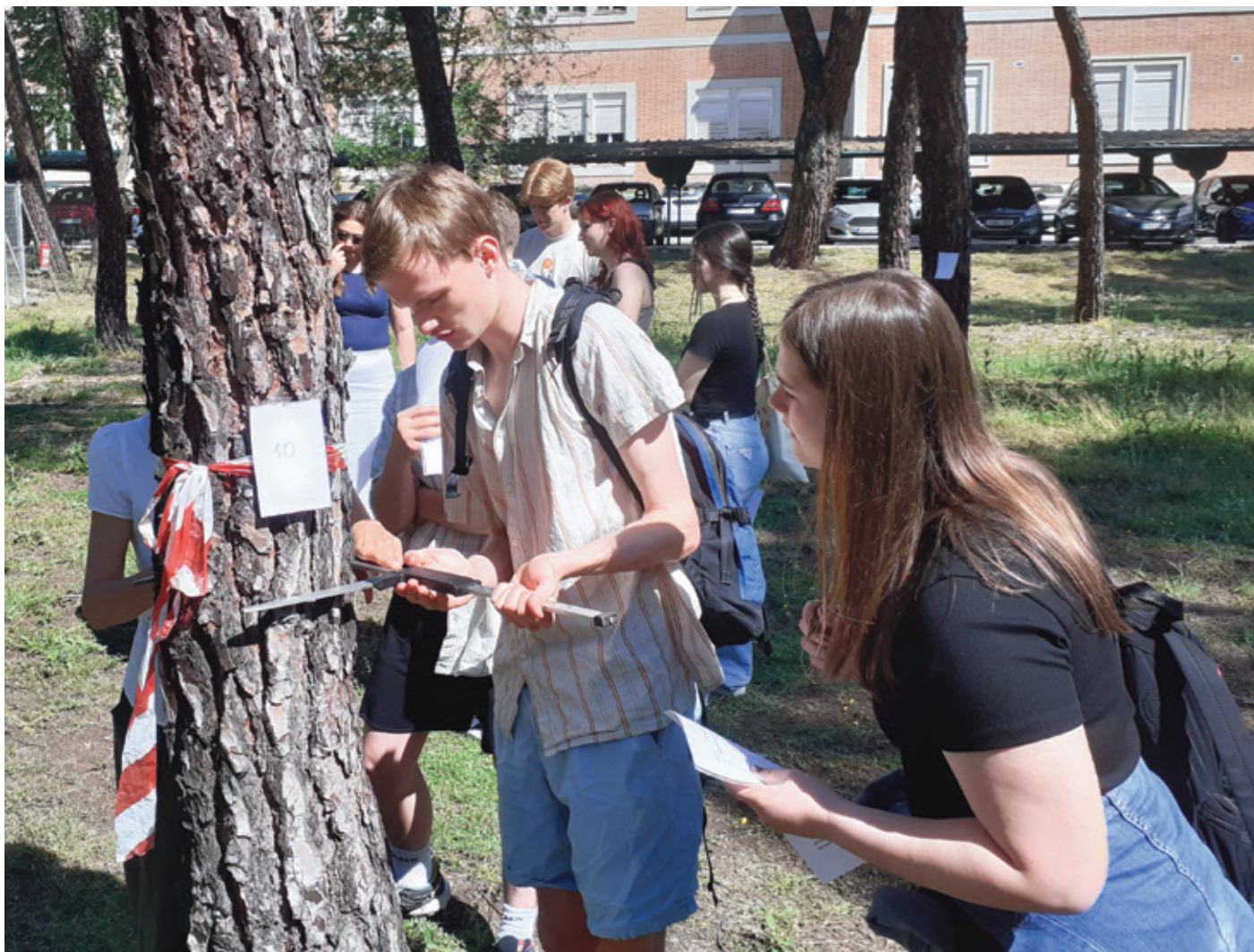
Danske, serbiske og spanske elever i Madrid, hvor de måler træers masse og kapacitet for lagre CO 2 .