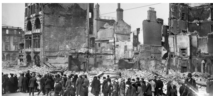
Dublin efter påskeoprøret, april 1916

Flere oprør og vedvarende politisk pres førte først til opblødningen af restriktionerne i midten af 1800-tallet, mens Irland senere fik hjemmestyre, omend stadig under den britiske krone, i 1914. Påskeoprøret i 1916 og det hårde britiske modsvar førte til, at Irland i december 1921 fik sin uafhængighed – først som en del af det britiske "Commonwealth", som det forlod i 1948.