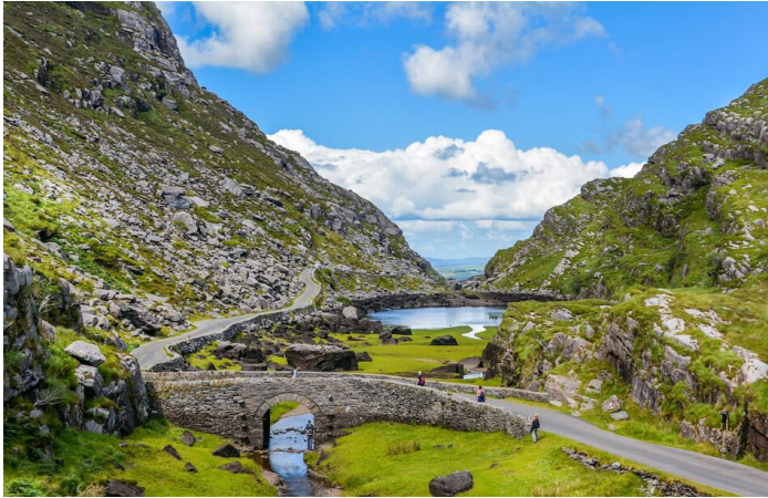
Gap of Dunloe, et smalt bjergpas, der løber nord-syd i County Kerry, og adskiller MacGillycuddy's Reeks-bjergkæden i vest fra Purple Mountain Group-kæden i øst.