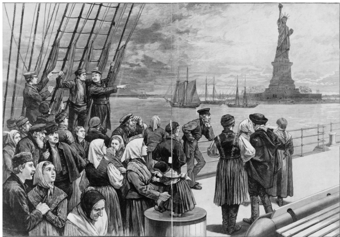
Irske emigranter ankommer til Ellis Island i New York.

Det anslås, at i alt 10 mio. irere igennem historien er emigreret væk fra øen, og at omkring 80 millioner mennesker i hele verden kan spore deres aner tilbage til øen. Det er derfor ingen underdrivelse at sige, at Irlands historie i høj grad er præget af de mange immigrationsbølger, der har været i landet.