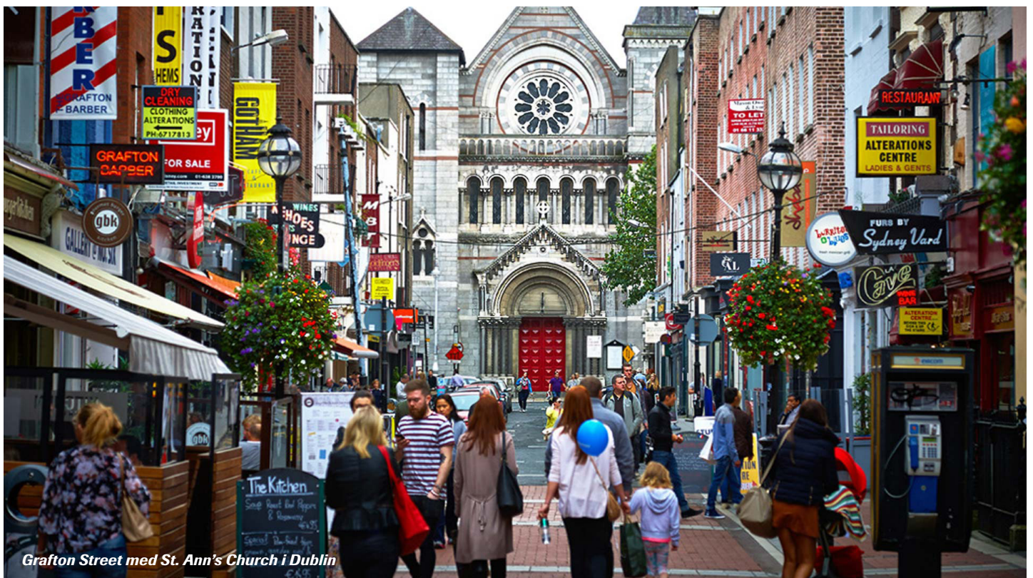
Grafton Street med St. Ann's Church i Dublin

info@deo.dk ■ tlf. 70 26 36 66 ■ www.deo.dk