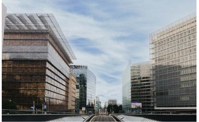
Rue de la Loi i det europæiske kvarter i Bruxelles. Det Europæiske Råd på venstre side og hovedkvarteret for Europa-Kommissionen på højre side.

EU-Kommissionen kommer med forslag til politikker og ny lovgivning, mens Rådet sammen med Europa-Parlamentet er de vigtigste beslutningstagende organer. Det er dermed Kommissionens primære opgave at fremlægge forslag til love og politikker, mens det er Rådet sammen med Europa-Parlamentet, der vedtager lovene og politikkerne. På trods af at Europa-Parlamentet officielt ligger i Strasbourg, sker meget af arbejdet tilknyttet parlamentet i Bruxelles.