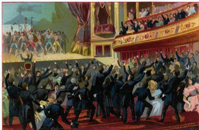
I 1830 blev der opført en opera i Bruxelles for at fejre kongens fødselsdag. 'La Muette de Portici' forårsagede imidlertid borgerlig uro og betød starten på den belgiske revolution, som førte til oprettelsen af Kongeriget Belgien.

Byen blev grundlagt i 979, hvor et lille fort blev bygget i et område, der dengang var hovedsageligt mose. Byen voksede, og i 1183 blev Bruxelles hovedstad i hertugdømmet Brabant. Senere blev byen større og i 1400-tallet konkurrerede byen med Paris om kunst og kultur. Bruxelles blev nu residensby for hertugdømmet Burgund.