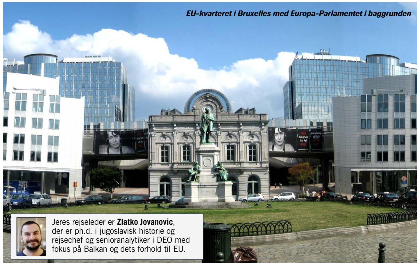
EU-kvarteret i Bruxelles med Europa-Parlamentet i baggrunden

Vaya Con Dios hittede i starten af 90'erne med sange som "What's a Woman?", "Nah Neh Nah" og "Heading For A Fall".