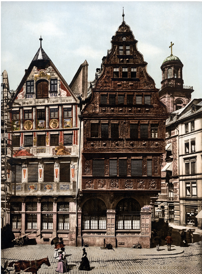
Den historiske facade af Salzhaus på Römerberg-pladsen, i år 1900. Salzhaus blev oprindeligt bygget omkring år 1600, men blev stort set ødelagt i 2. Verdenskrig.