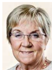
Marianne Jelved, tidligere kulturminister og undervisningsminister for Det Radikale Venstre:

(Citeret i artiklen "Dannelse er det modsatte af barbari" i Kristeligt Dagblad, den 19. juni 2015)