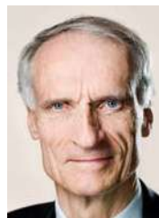
Bertel Haarder, tidligere kulturminister og undervisningsminister for Venstre:

”...vi har fået både romantikken, kulturradikalismen, arbejderbevægelsen og juletræet fra Tyskland - for slet ikke at tale om den kongelige ballet og melodien til kongenationalsangene. Hvad var Danmark uden udenlandske rødder? Men vi har gjort det til noget pæredansk, og det er den proces, der skabte en guldalder. At man satte sig for at omsætte udenlandske inspirationer til noget pæredansk.”